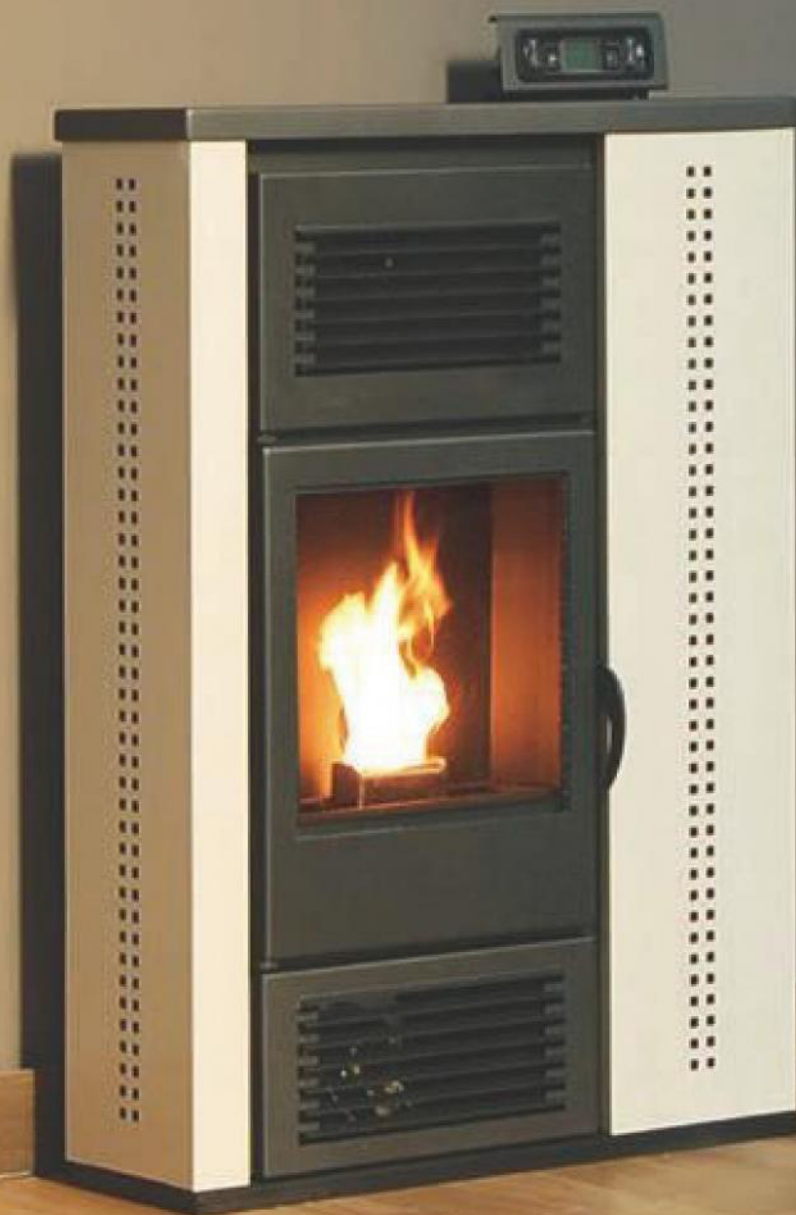
Tablet 110 beige

OPCIONAL KIT DE CANALIZACION HASTA 10 METROS POR 100 EUROS