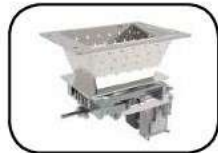
Brasero de autolimpieza