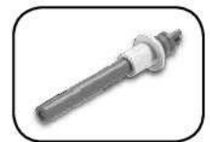
Resistencia de cerámica