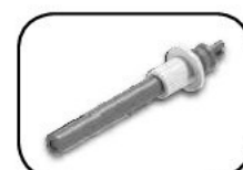
Resistencia de cerámica