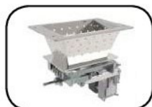
Brasero de autolimpieza