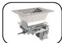
Brasero de autolimpieza