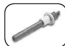
Resistencia de cerámica