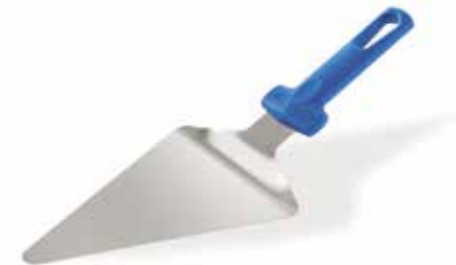
PALETTA TRIANGOLARE Triangular pizza slice