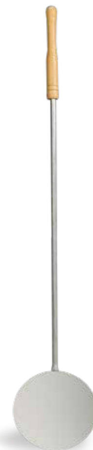
PALA TONDA INOX Rounded stainless steel shovel