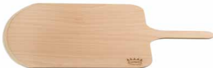
PALA CON IMPUGNATURA 55x35 cm Paddle with haft 55x35 cm