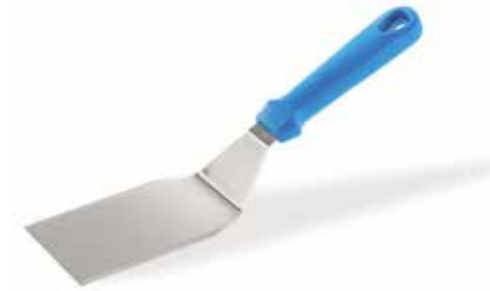
PALETTA RETTANGOLARE Rectangular pizza slice