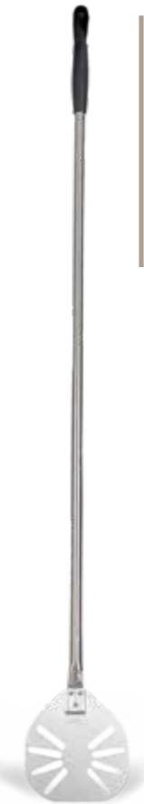
PALETTINO ALLUMINIO ASOLATO Stainless steel looped little shovel