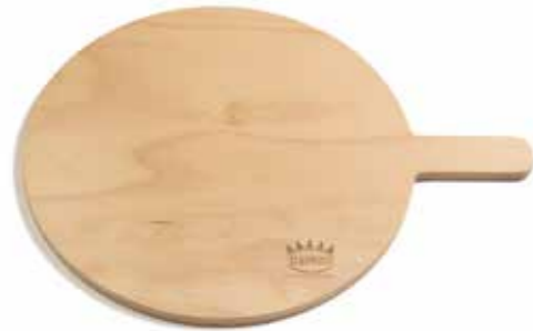
TAGLIERE TONDO CON IMPUGNATURA Ø33 cm Rounded chopping board Ø33 cm