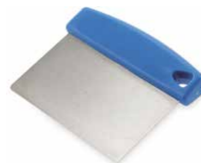
TAGLIAPASTA Dough cutter