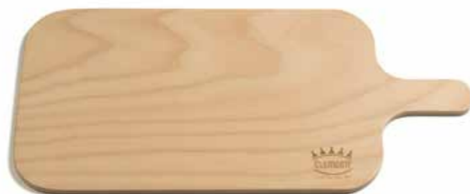
TAGLIERE RETTANGOLARE CON IMPUGNATURA 35x22 cm Rectangular chopping board with haft 35x22 cm