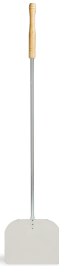
PALA RETTANGOLARE INOX Squared stainless steel shovel