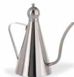
OLIERA Stainless steel cruet