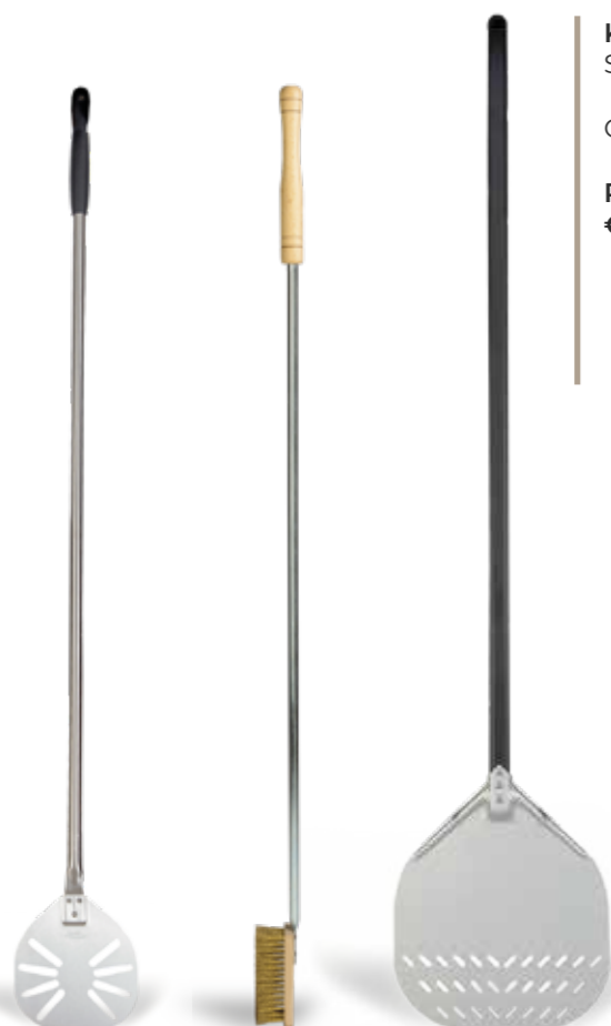
Kit PALE Shovels Kit