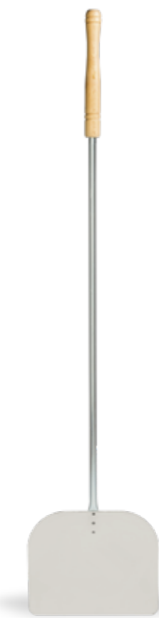
Kit PALE Shovels Kit