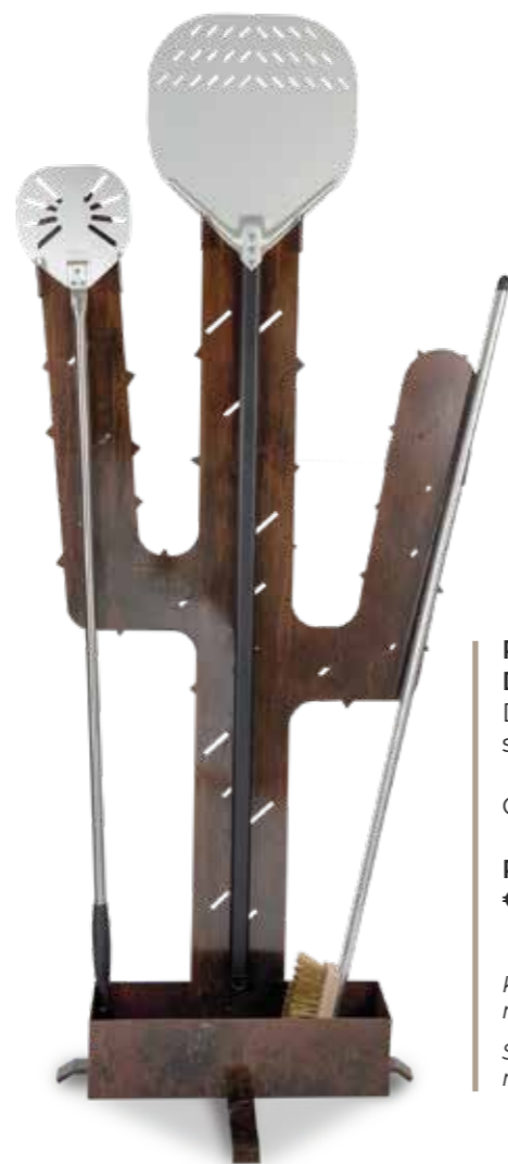
PORTAPALE DJANGO Django shovel-holder