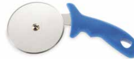
ROTELLA TAGLIAPIZZA Wheel pizza cutter