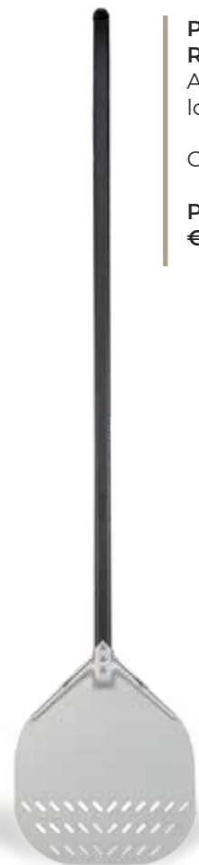
PALA ALLUMINIO RETTANGOLARE ASOLATA Aluminium rectangular looped shovel