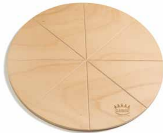
TAGLIERE TONDO SPICCHI INCISI Ø44 cm Round chopping board with engraved segments Ø44 cm